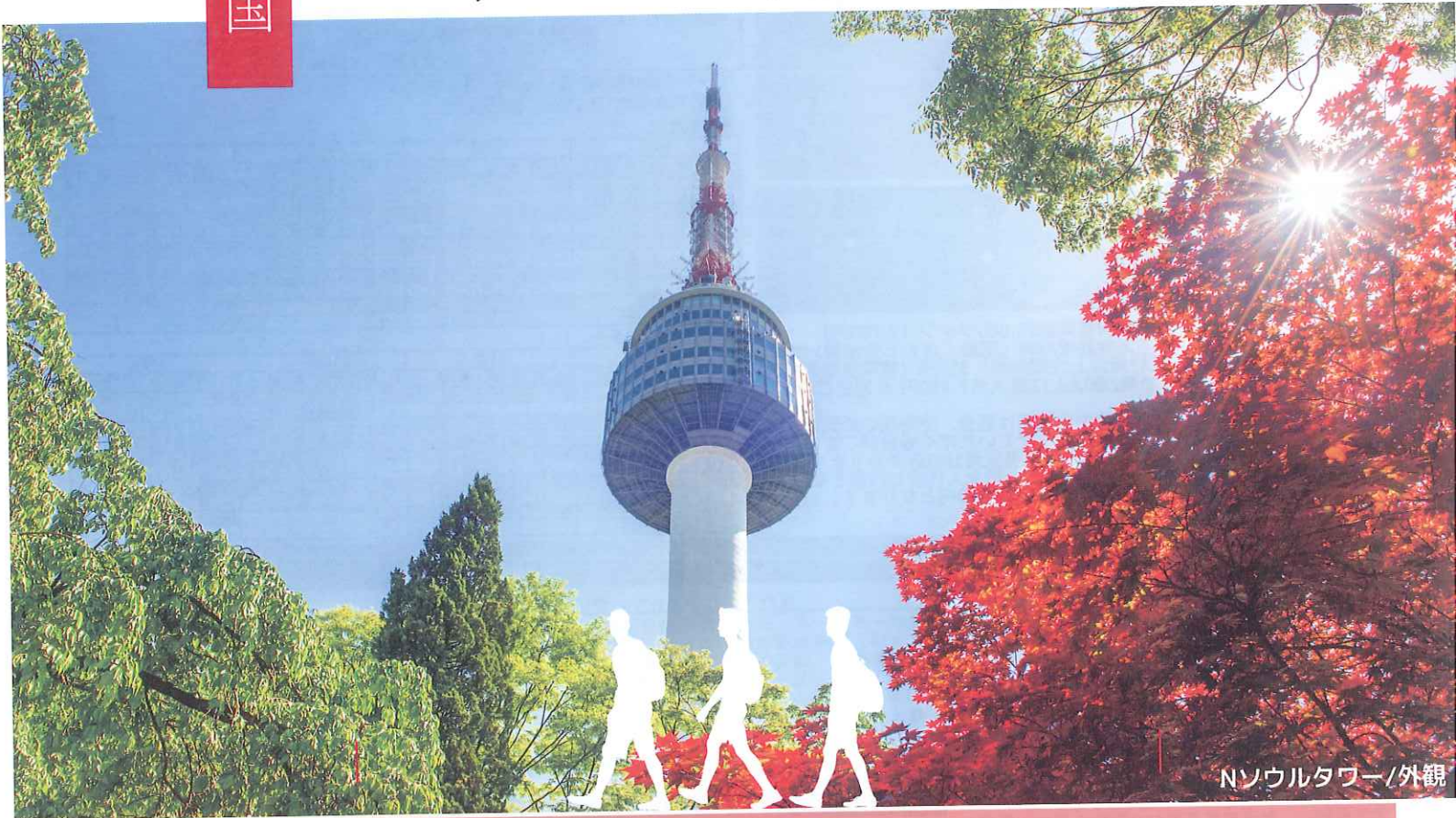
Nソウルタワー/外観

3日間/明洞スタンダードクラスホテル泊 (2・3名様1室利用/大人1名様) ※燃油サーチャージ・国内空港施設使用料 旅客保安サービス料等及び海外諸税別途