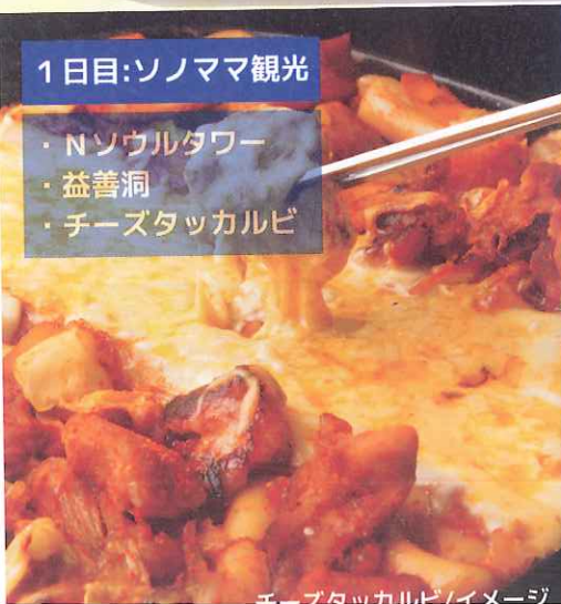
チーズタッカルビ/イメージ