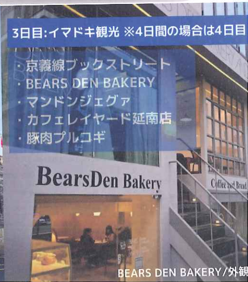
BEARS DEN BAKERY/外観