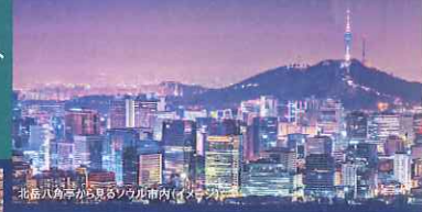
北岳八角亭から見るソウル市内(イメージ)

月曜日出発 1日目 ソウルを一望できる展望スポット 北岳八角亭・ 北岳スカイウェイ