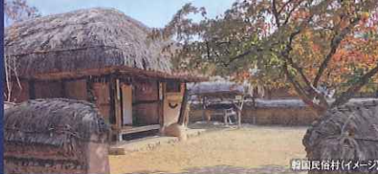
韓国民俗村(イメージ)