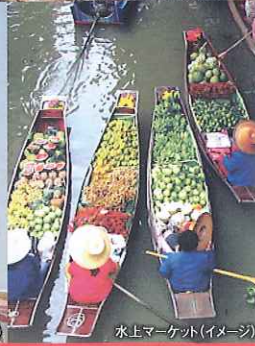
水上マーケット(イメージ)