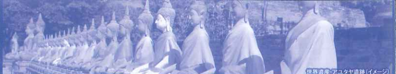
世界遺産:アユタヤ遺跡(イメージ)

クラス指定 利用予定ホテル(ホテルは指定できません) エコノミークラス ●ロイヤル ベンジャ ●マンハッタン スクンビット ●ホーランド ●ロータス スクンビット