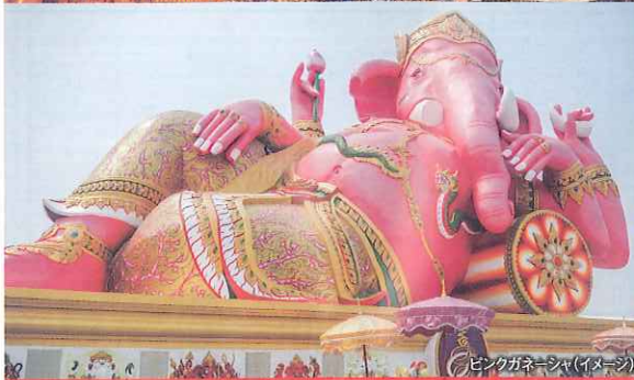
ピンクガネーシャ(イメージ)