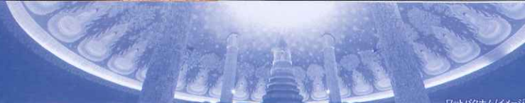
ワットバクナム(イメージ)

■食事条件(機内食はございません) / ●4日間:朝食2回、昼食2回、夕食2回 ●5日間:朝食3回、昼食2回、夕食2回 ※機内食は有料となります