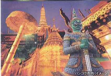
バンコク市内(イメージ)