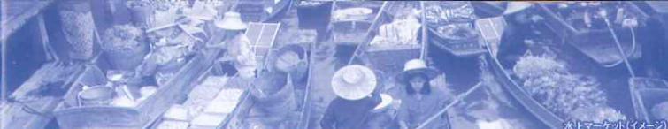
水上マーケット(イメージ)