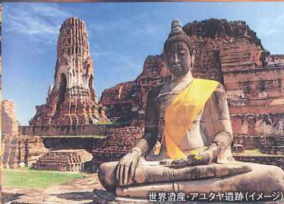
世界遺産・アユタヤ遺跡(イメージ)