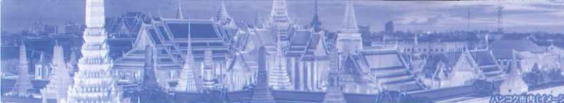
バンコク市内(イメージ)