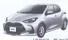
USクラス一例 ヤリス(P56)