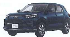
JSクラス車例 ライズ(P56)