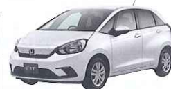
USクラス車例 フィット(P56)