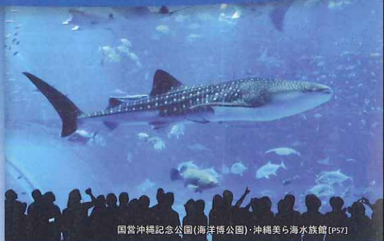
国営沖縄記念公園(海洋博公園)・沖縄美ら海水族館 [P57]