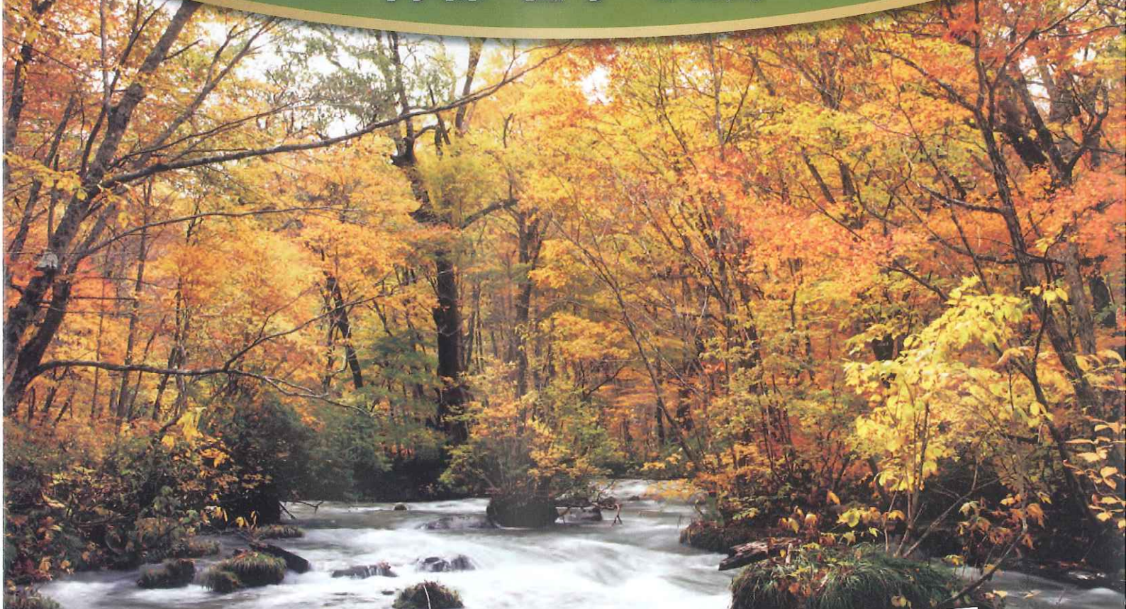
おいらせ 奥入瀬溪流 (イメージ)