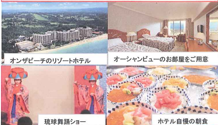
オンザビーチのリゾートホテル